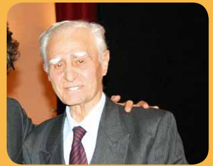
Polisportiva Libertas Partanna