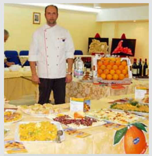
Ribera, arance a tavola

dono con gli amministratori, con i deputati regionali e nazionali e con il governo che deve "restituire la dignità ai produttori agricoli locali, attivandosi per la valorizzazione del territorio, delle tradizioni e